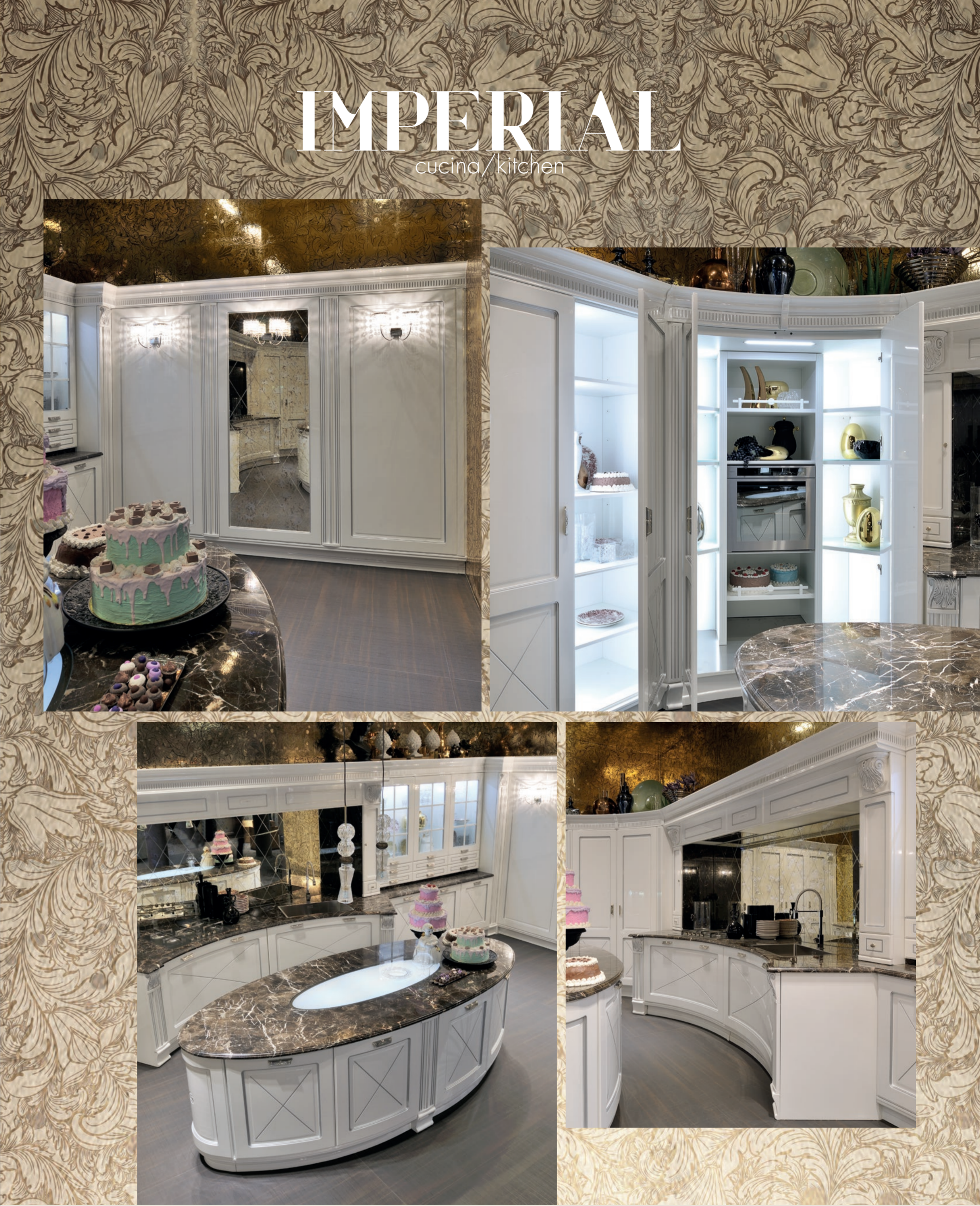
Imperial / L1. 360 P. 60 H. 217 / L2. 677 P. 60/110 cm. Composizione con ante laccate bianco lucido e argento lucido. Piano di lavoro in marmo mistic brown h 3 cm.

Composition with lacquered white and glossy silver doors. 3 cm thick marble worktop in mistic brown finish.