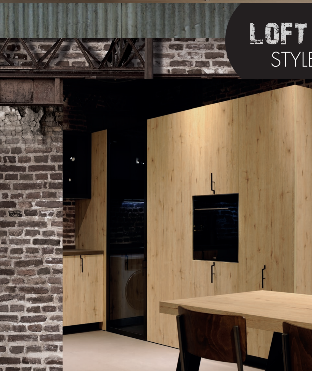
Lab13 / L.1 600 P. 64,5 H. 231 / L.2 227 P. 94 H. 231 cm. Composizione Plana in melaminico con basi beton e rovere Nuova Zelanda, pensili in telaio nero con vetro effetto tessuto scuro, colonne in rovere Nuova Zelanda. Piano Must in quarzo h 4 cm marrone torba spazzolato.

Plana composition with bases in beton and New Zealand oak, dark fabric texture glass with black frame wall units, columns in New Zealand oak. 4 cm thick peat brown in must brushed quartz.