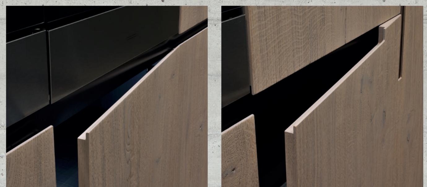
Lab13 / L1. 420 P.75 H. 231 / L2. 450 P.63,7 H. 231 cm Composizione con ante Forma e Forma sagomata con basi grigio siliceo, pensili laccato grigio grafite opaco, colonne in essenza rovere nodato sabbia. Piano di lavoro Smart grigio topo sabbia h 3 cm.

Forma and contoured Forma composition with siliceous grey bases, matt lacquered graphite grey wall units, columns in sand knotted oak essence. 3 cm thick mouse grey Smart worktop.