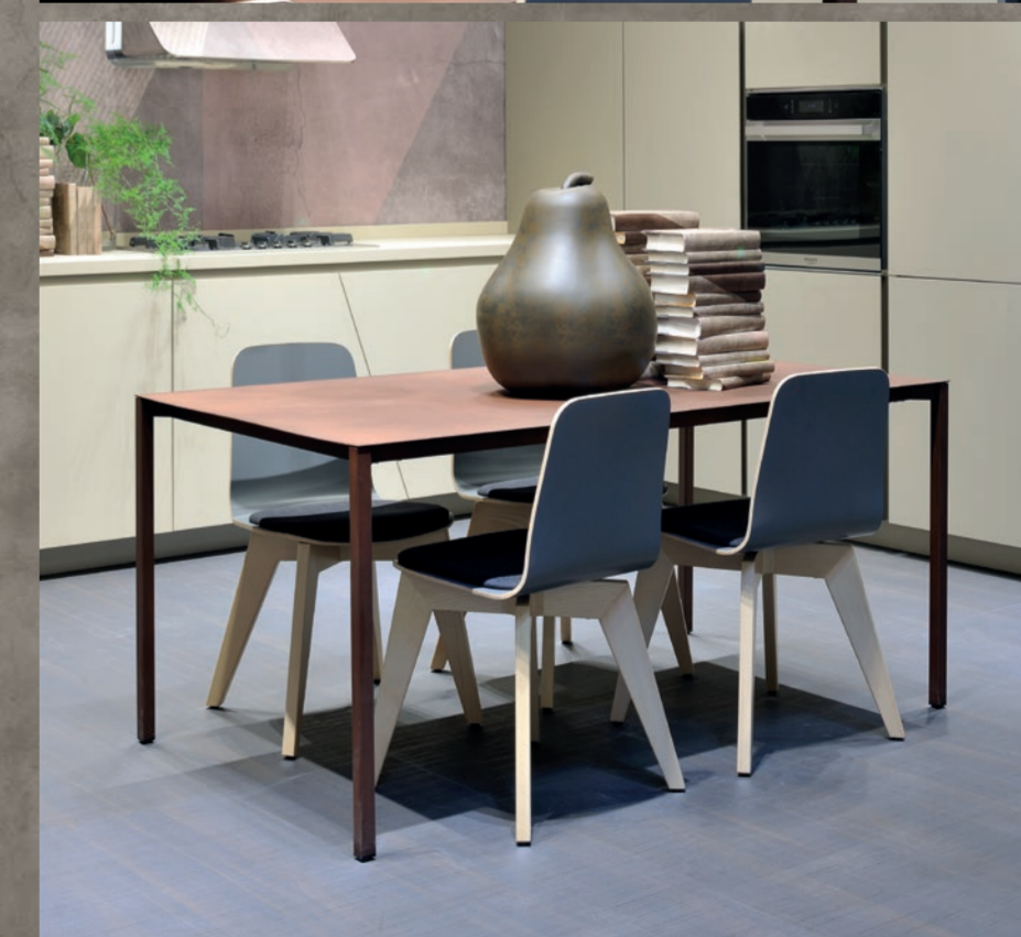
Lab13 / L1. 492, P. 64,5 H. 231 / L.2 402 P. 63,7 H. 231 cm Composizione con anta Acuta in FENIX NTM®, basi beige luxor, colonne castoro ottawa. Piano di lavoro in FENIX NTM® h 4 cm beige luxor.

Composition with Acuta doors in FENIX NTM®, bases in beige luxor, columns in castoro ottawa. 4 cm thick FENIX NTM® worktop in beige luxor finish.